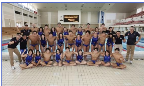
* 企業チームやクラブチームを応援します！

社会人スポーツの振興に寄与することを目的とし、社会人スポーツ推進企業の認定や強化支援事業の実施、優秀選手等の確保に取り組んでいます。