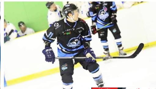
仕事 × スポーツ