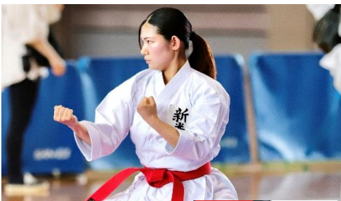
仕事 × スポーツ