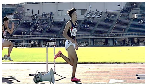
仕事 × スポーツ