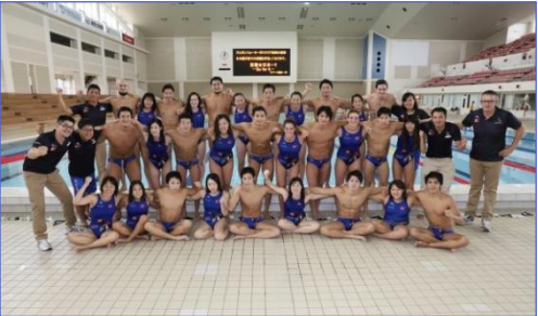
* 企業チームやクラブチームを応援します！

社会人スポーツの振興に寄与することを目的とし、社会人スポーツ推進企業の認定や強化支援事業の実施、優秀選手等の確保に取り組んでいます。