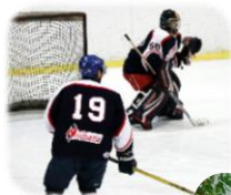
アイスホッケー選手は働きながら夜間に練習し74冬季国体ベスト16に！